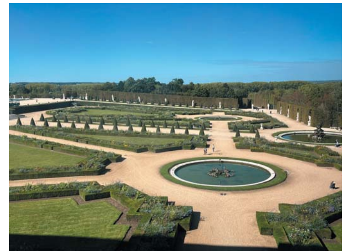
Text Karolína Grygová

stanete mapu a přesně vyhrazené cesty. Celá vyjížďka zabere asi hodinu a opravdu stojí za vidění. Paříž patří mezi nejkrásnější evropská města a doporučuji návštěvu.