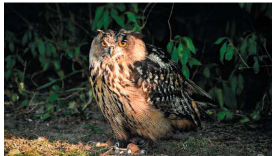
Kateřina Vejvarová, foto ze soukromého a klubového archivu

A to je asi všechno. A pokud se ti naše činnost líbí, můžeš se někdy přijít podívat nebo se přihlásit. Tak dobrý let!