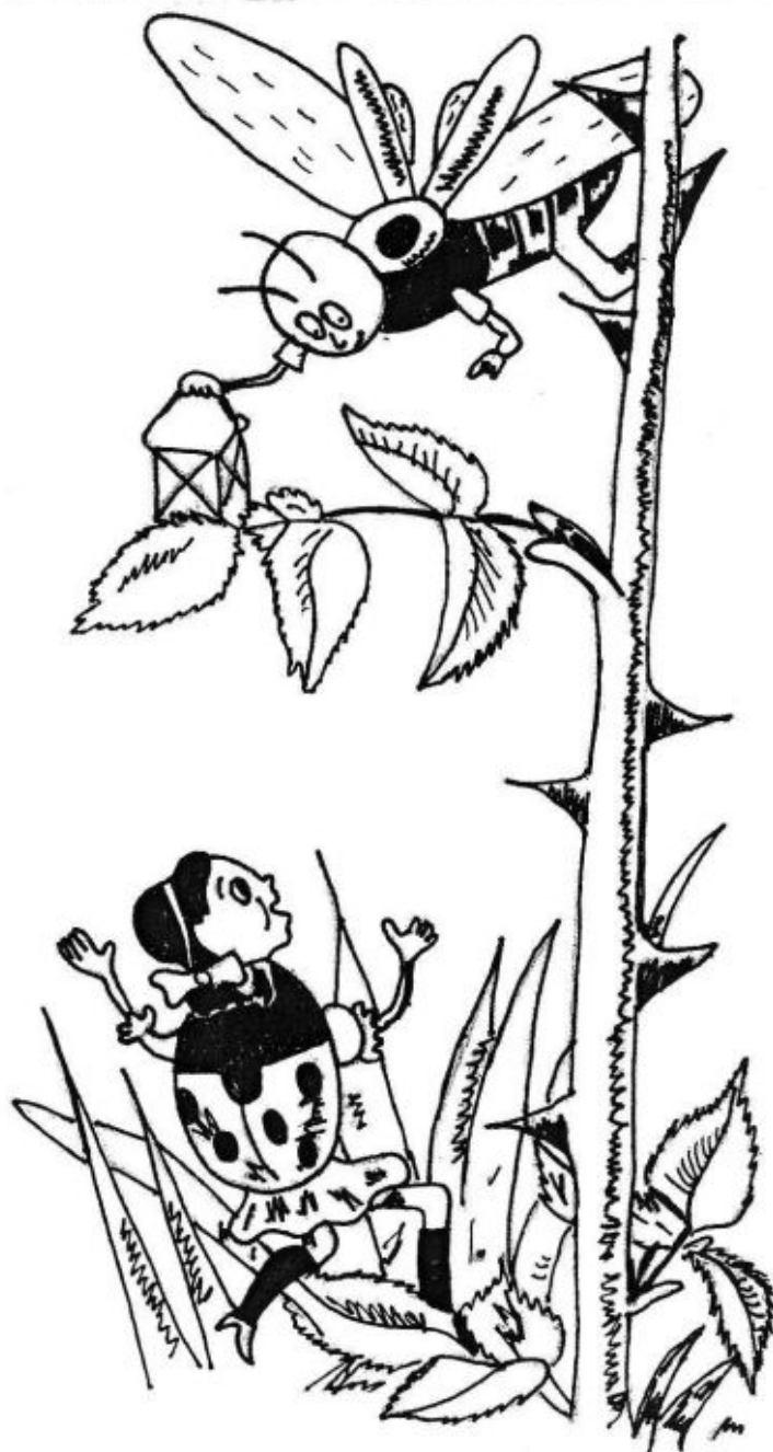
(10) (Rubešová Zuzana, 8.B)